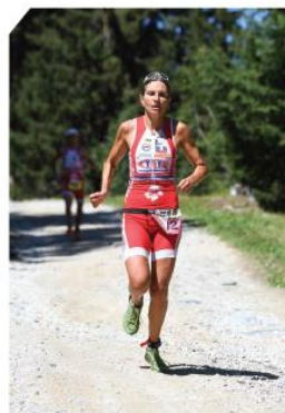
RUN - 6,3 KM (180M D+/-)