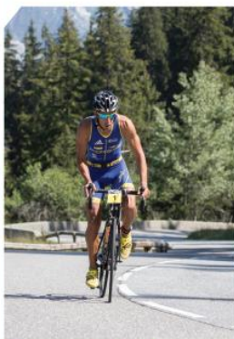
BIKE - 17 KM (1000M D+ / 80M D-)