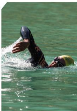
SWIM - 750 M